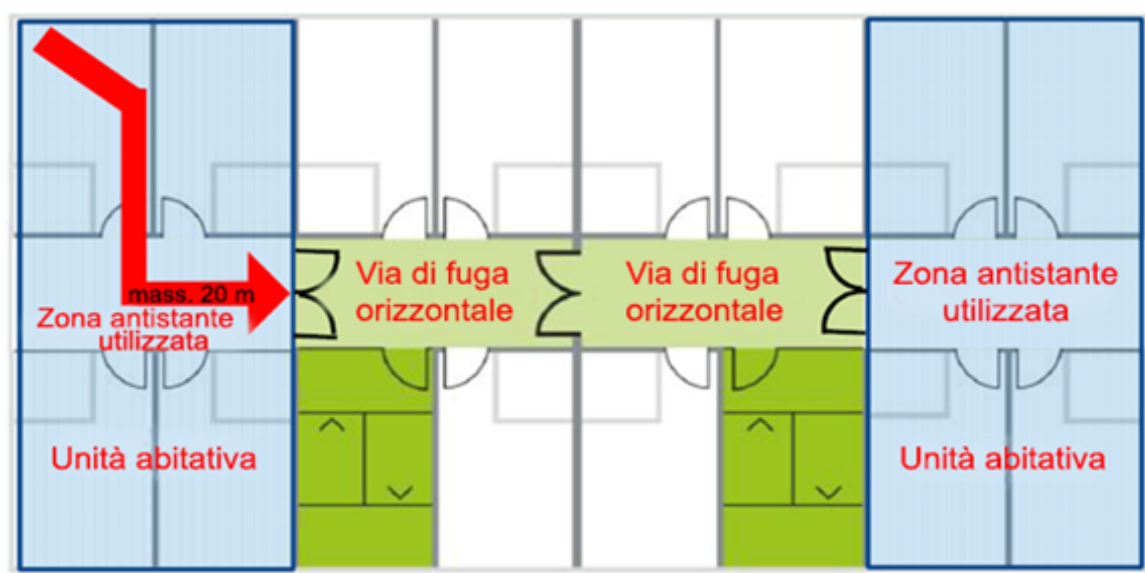
Grafico: caso normale di attività di alloggio [a] con \geq 3 piani

Nel caso normale le vie di fuga nelle attività di alloggio [a] hanno il seguente aspetto: